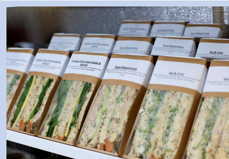
Hemmung des mikrobiellen Wachstums bei Kombinationsprodukten