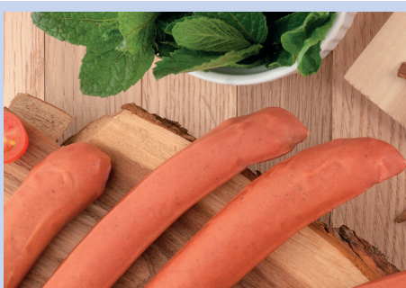
Hemmung des mikrobiellen Wachstums bei Wurstwaren