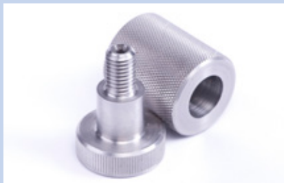
Nitrierhärtung von Metallen